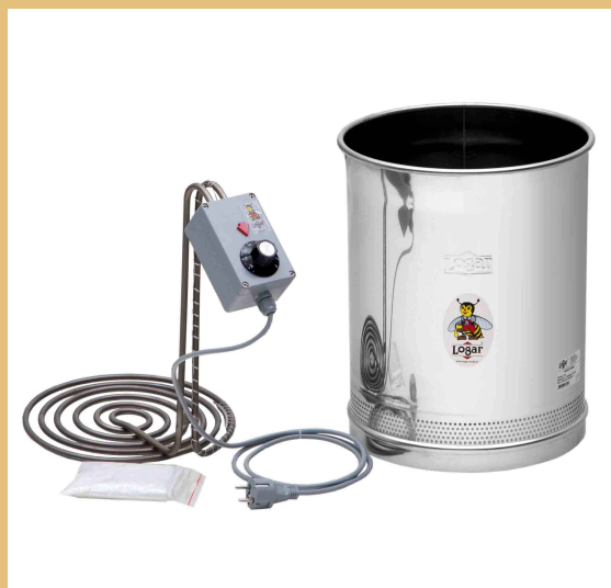
Logar Honeytherm zum

Jetzt um € 389,00 anstatt € 419,00 (Gültig solange der Vorrat reicht)